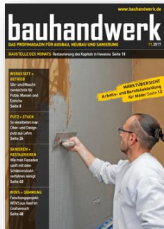
Print: 2 Anzeigen