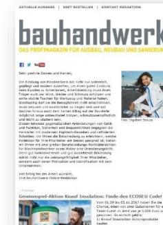
Newsletter: 1 Fullsize Banner