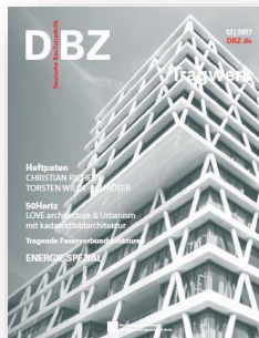
Print: 2 Anzeigen