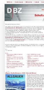
Newsletter: 5 Fullsize Banner