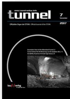
Print: 1 Anzeige