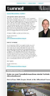
Newsletter: 2 Fullsize Banner