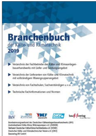
Branchenbuch der Kälte- und Klimatechnik

Dieses umfassende Branchenverzeichnis bietet die Adressen aller in den Branchenverbänden organisierten Kälte-Klima-Fachbetriebe, die Adressen wichtiger Lieferanten und Hersteller im Kälte- und Klimabereich, ein Produktgruppenverzeichnis zum schnellen Auffinden der Lieferanten für bestimmte Produkte, wichtige Normen, Verordnungen, Vorschriften sowie chemische und physikalische Grundlagen für den Kälteanlagenbauer.