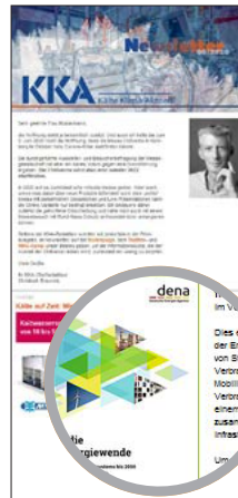
KKA Kälte Klima Aktuell Newsletter